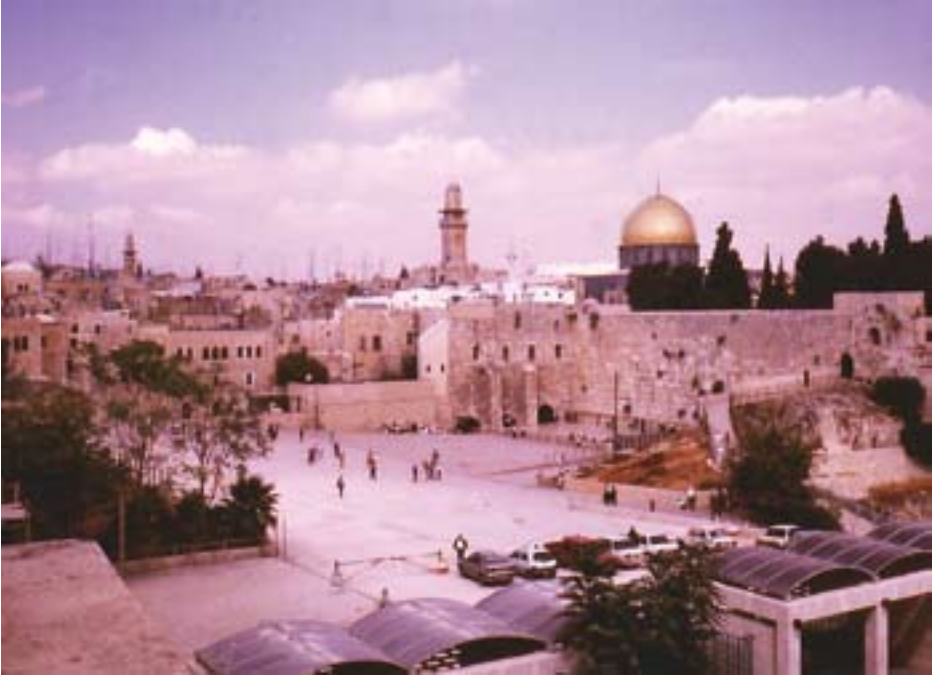
84. ཡེ་ལུ་ག་ལེམ།