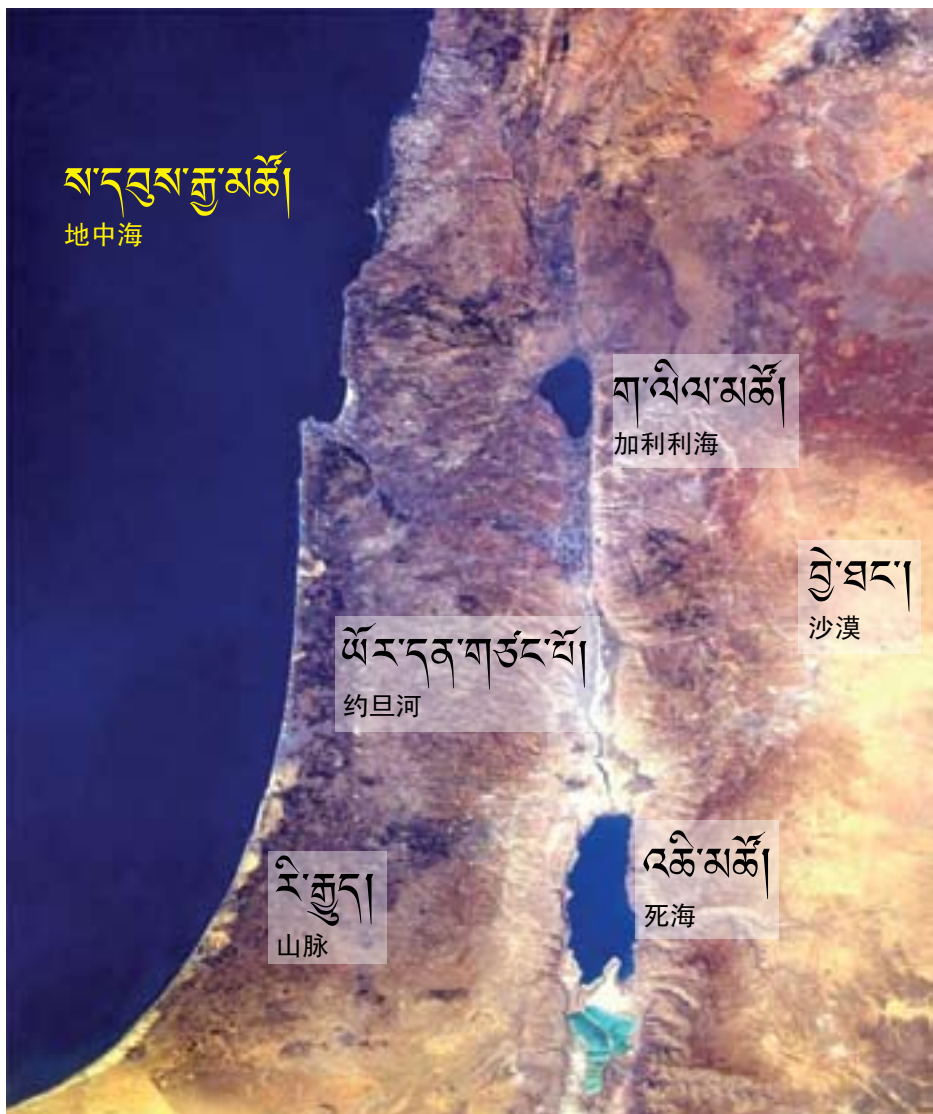
75. ཡི་སི་ར་ཨེལ་ཡུལ་ཨང་2