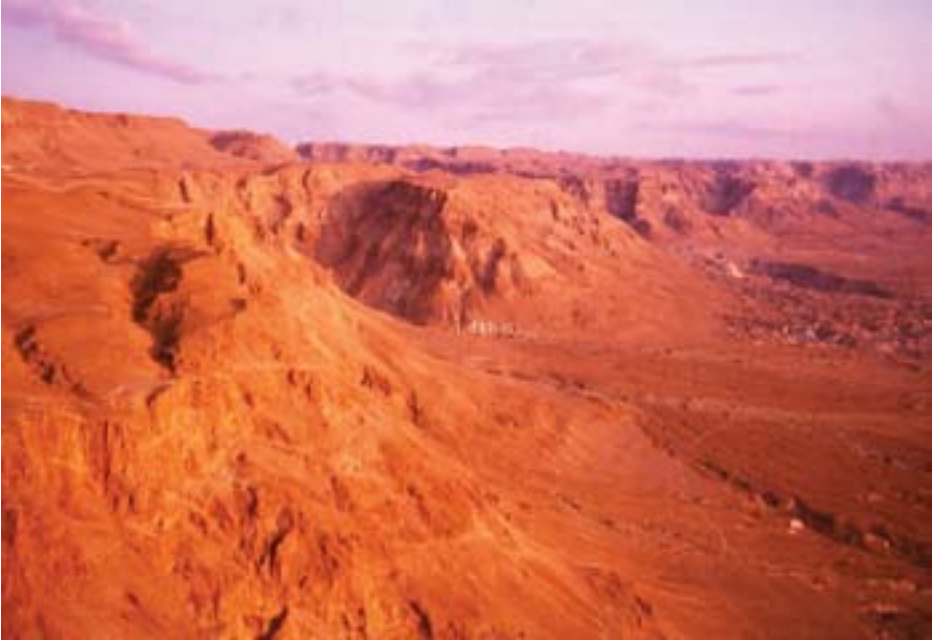
86. ཡི་སི་ར་ཨིལ་གྱི་ཡུལ་ལྗོངས།