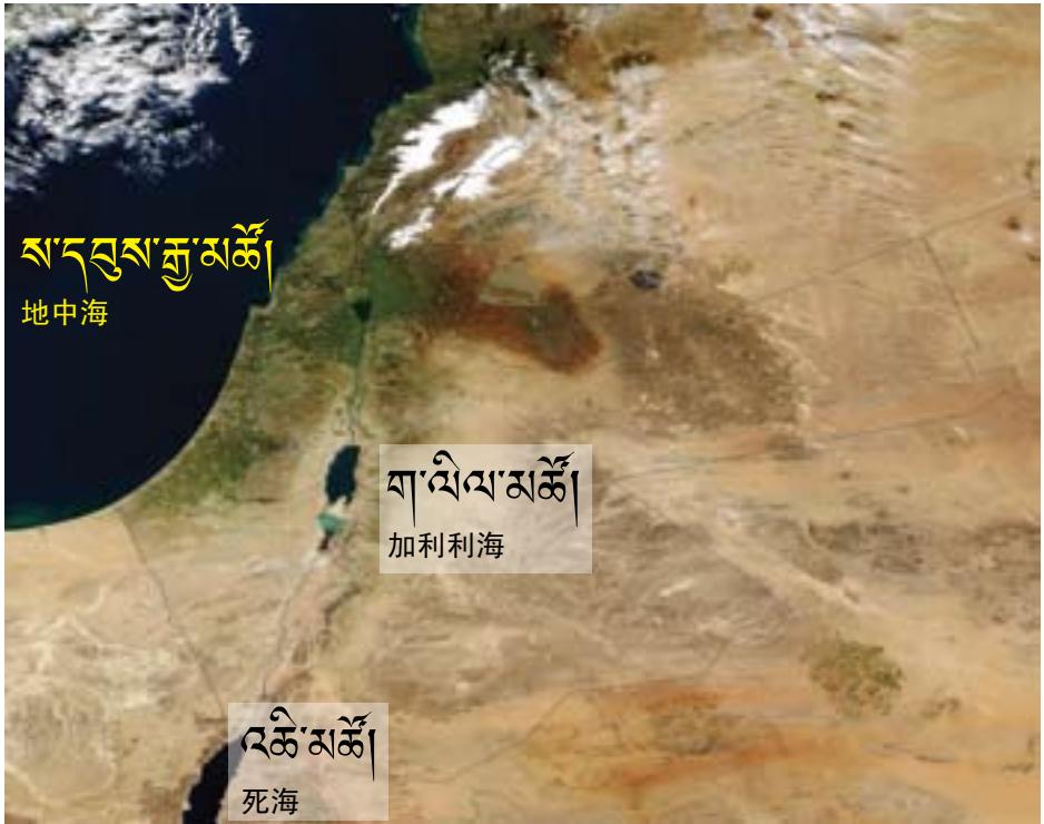
73. ཡི་སི་ར་ཨེལ་ཡུལ་ཨང་1