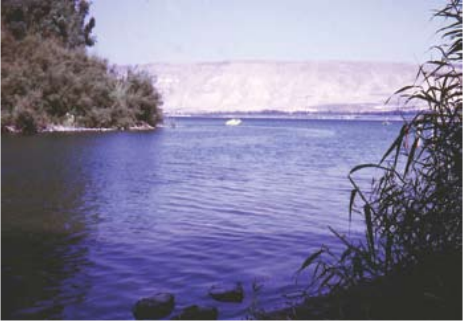
85. ཡོར་དན་གཙང་པོ་དང་ག་ལིལ་མཚོ།