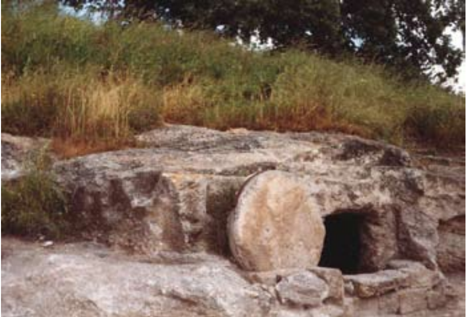
88. དུར་ཁུང་ཞིག