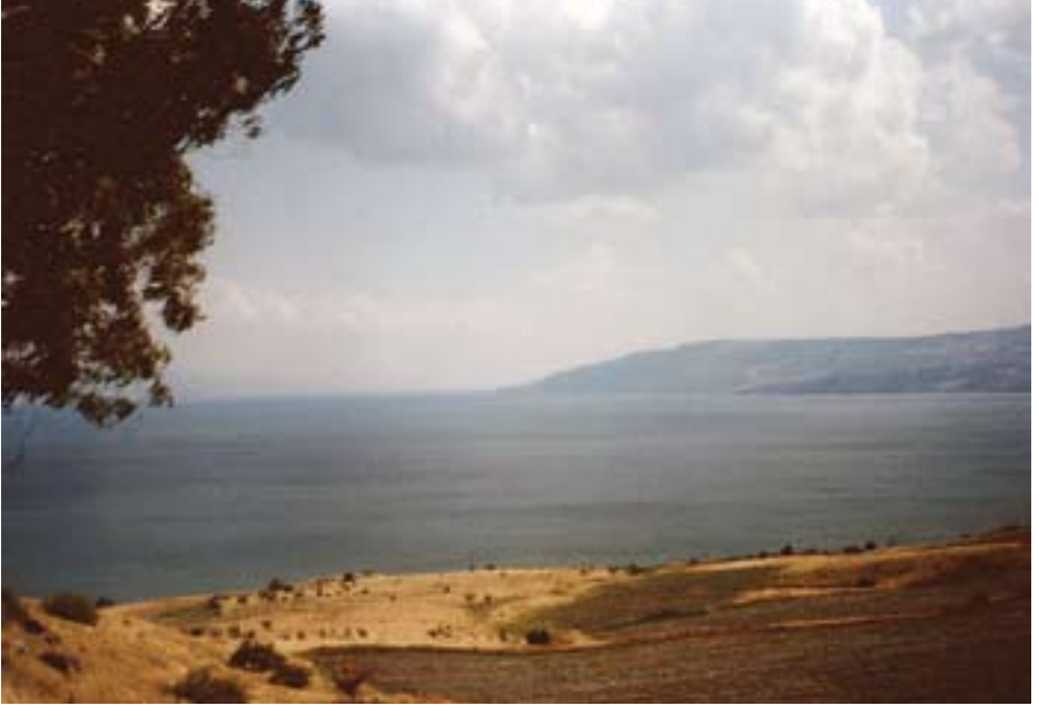
87. གླ་ལེའུ་ལྷ་པོ།